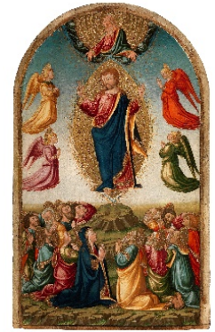
Galerie Sarti Giovanni - Paris Neri di BICCI (Florence 1418 – 1492) L'ascension du Christ €100,000-150,000