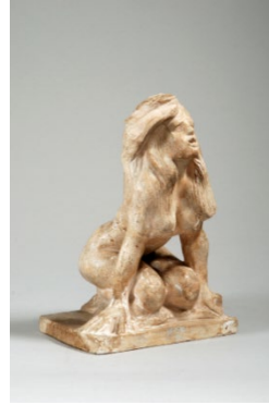
Galerie Univers du Bronze – Paris Auguste Rodin La Succube, Femme nue agenouillée €120,000-180,000