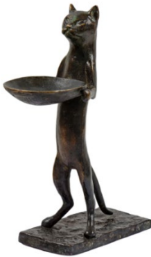
Galerie Beres - Paris Diego Giacometti Chat Maître d'Hôtel €150,000-250,000