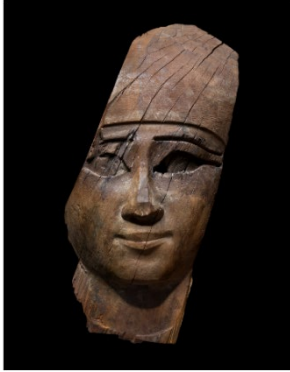
Galerie Ariadne – New-York Masque de sarcophage en bois datant de l'Égypte Ancienne €70,000-90,000