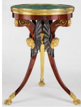
Galerie Neuse – Allemagne Guéridon impérial russe par H. Gams €200,000-300,000